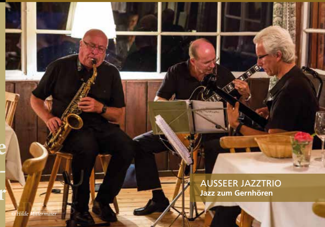
AUSSEER JAZZTRIO Jazz zum Gernhören