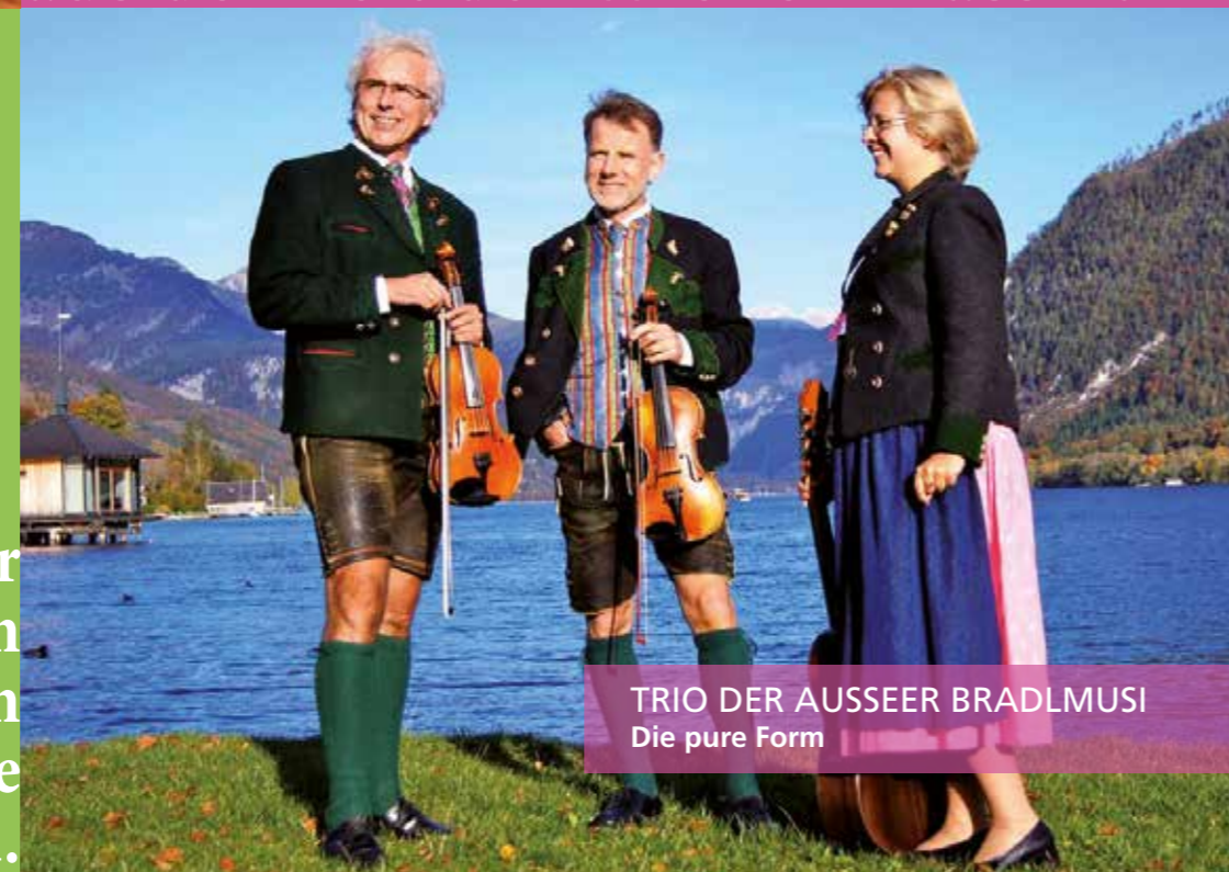
TRIO DER AUSSEER BRADLMUSI Die pure Form

Vom getragenen Geigenjodler bis zur frischen Polka, vom melodienreichen Steirischen bis zu Märschen und Menuetten aus dem 19. Jahrhundert und natürlich die beliebten Gstanzln, zu denen gepascht wird.