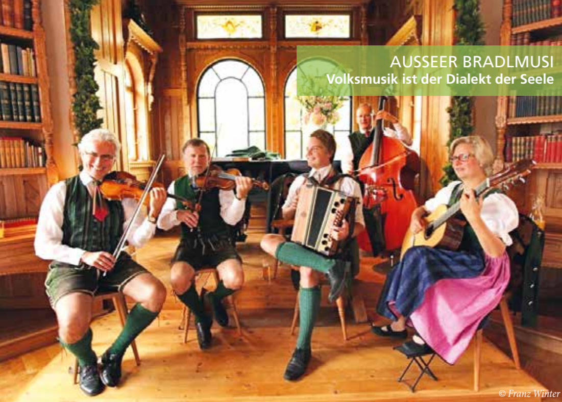
AUSSEER BRADLMUSI Volksmusik ist der Dialekt der Seele